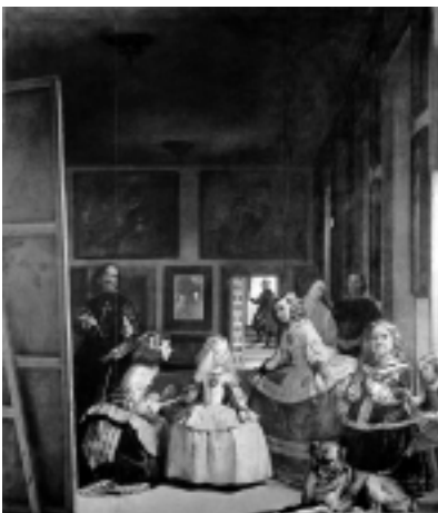
Les Ménines de Velázquez

Comment voyez vous Rosaura ? comme une rebelle ou une inadaptée de la société ?