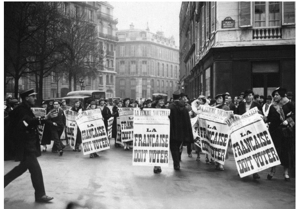
Manifestation à Paris. Mai 1935

Il faut ici parler de l'hérédité, de la transmission du nom, du sang, du patrimoine. A l'exception de certains régimes juridiques, la transmission patrimoniale voire celle du nom se faisait (et se fait encore dans certaines cultures) par le premier mâle né. Justifié par principe par des raisons économiques, cet état de fait ne touchait pas uniquement les classes aristocratiques mais aussi les paysans, les artisans et les bourgeois. Les conséquences de cette différenciation par l'héritage entre garçons et filles ont pu être dévastatrices tant du point de vue personnel et individuel que du point de vue collectif notamment à travers le prisme de certaines politiques de contrôle des naissances. Cette domination s'exprime d'ailleurs aussi de façon symbolique dans la perte d'identité première des filles liée au changement de nom qu'engendre traditionnellement le mariage (c'est d'ailleurs ici que la jeune épouse rejoint dans l'identité la belle-mère/marâtre des contes de fées).