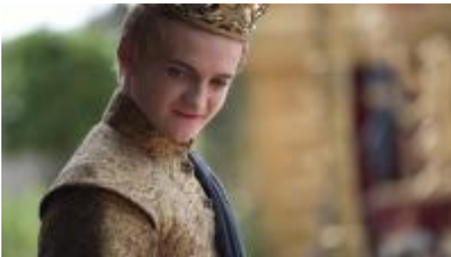
Joffrey - Games of Thrones, 2015

Notons que dans les contes traditionnels Princes et princesses sont adolescents voire « adulescents » jusqu'à ce qu'ils accèdent au Trône et à la famille. Le terme de « prince » vient de princeps , qui signifie « premier ». Fils de roi, ses aventures sont une quête initiatique qui lui permettra d'accéder à la maturité puis à la famille et au pouvoir.