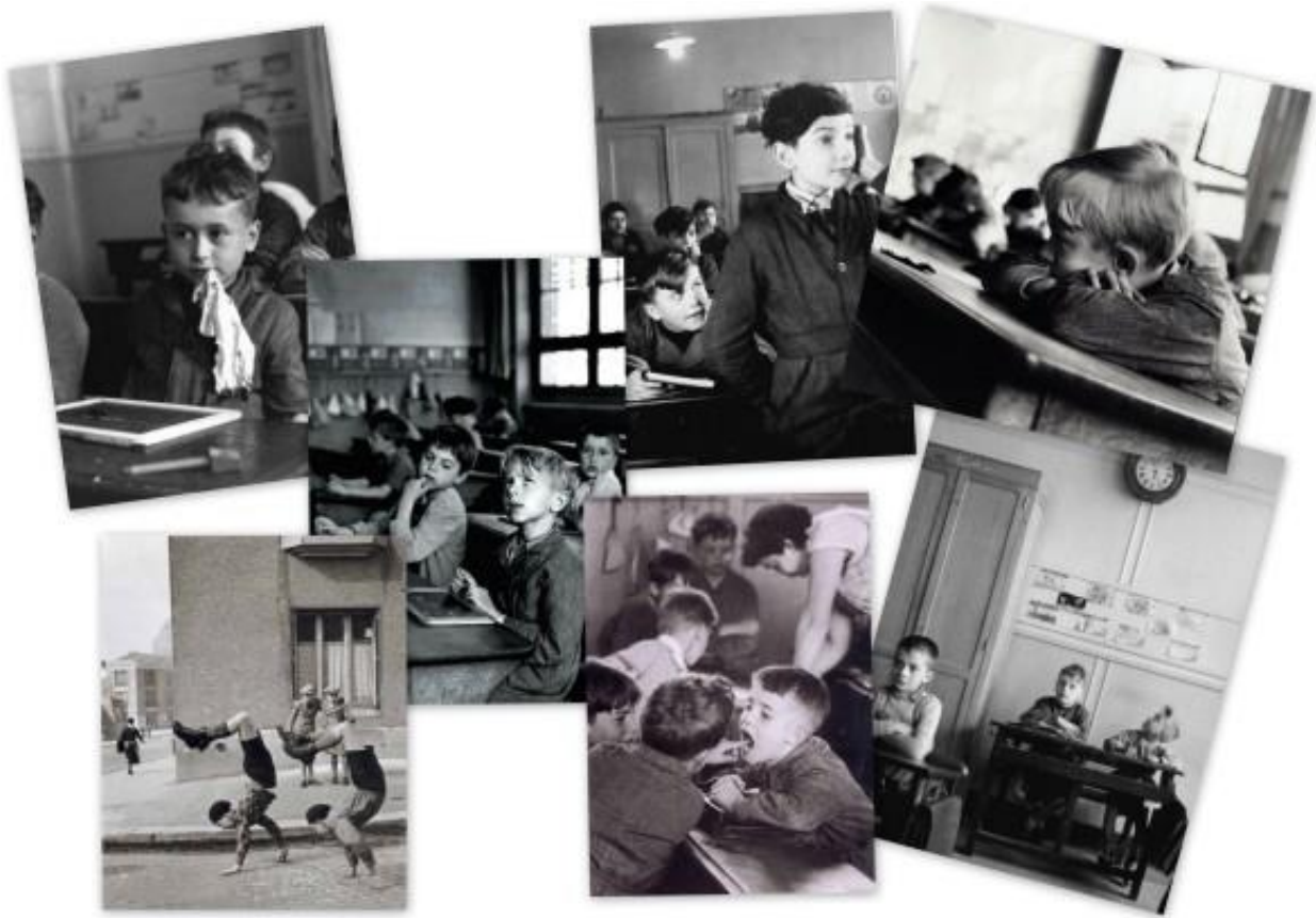
Les garçons et l'école vus par Robert Doisneau.

Il est tout aussi notable que la particularité seconde de ce spectacle tient au fait qu'il est joué in situ, dans les écoles, dans les bibliothèques ou tout autre lieu qui, à priori, ne relève pas d'une identité spectaculaire de théâtre. Il en résulte un épurement des décors, des accessoires, de tous les éléments iconographiques signifiants dans l'univers théâtral qui donne à la parole de l'acteur et à l'imaginaire du spectateur une puissance évocatrice singulière.