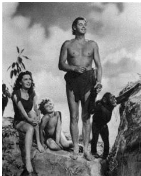
Tarzan l'homme singe, film de W.S Van Dyke, 1932

Il sera d'ailleurs fait par plusieurs fois référence à Tarzan dans la pièce tant parce qu'il est l'archétype du mâle essentiel que parce que son cri de guerre tétanise et méduse.