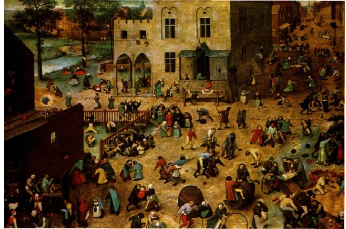
Jeux d'enfants de Pieter Bruegel. 1560

Pour les enseignantes, c'est le lieu le plus observable, le plus significatif des sociabilités juvéniles. C'est par excellence le lieu où à travers les jeux et l'occupation de l'espace, s'exercent en actes les rapports dominants/dominés doublés d'un rapport garçons/filles. C'est sur ce terrain que les enseignantes peuvent agir de la façon la plus concrète en accompagnement, encadrant, structurant toutes ces activités ludiques à très haut coefficient de sociabilisation.