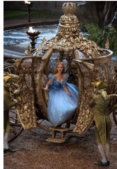
Cendrillon de Kenneth Branagh, 2015

Du prince, on sait en général peu de choses, si ce n'est qu'il doit être « charmant » (à quelques exceptions près), qu'il délivre la princesse et l'épouse.